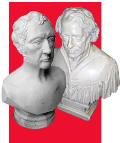
Hegel-Büste von Gerrit Arndt (© G. Arndt, 2011). Schleiermacher-Büste von Christian Daniel Rauch (Schleiermacherforschungsstelle, Universität Kiel).

Anmeldung bis zum 14.11.2018 unter: http://www.bbaw.de/anmeldung-SchleiermacherHegel